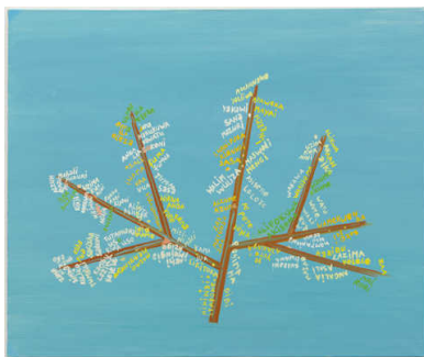
Werk van Daniëls (van boven naar beneden): Lentebloesem (1987),